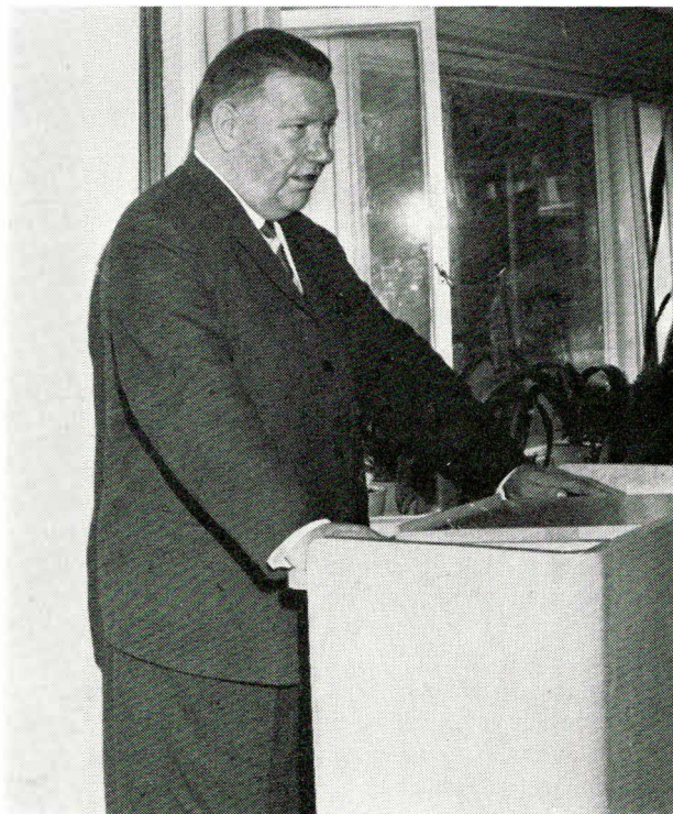
Forbundsformand Gösta Widing.